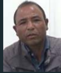
మినింగ్ స్థార్ సాక్ మీ 30, మైరాంగ్ గ్రామం, మేఘాలయ

పితృస్వామ్య విధానాలు కొన్నిసార్లు మహిళలు సమాజంలో తగిన గుర్తింపు లేకుండా చేస్తాయి. ఈ కథ ఒడిశా రాష్ట్రంలోని కలహండి జిల్లా లాంబింగ్ తహసిల్ లో ఉన్న ఒక గిరిజన గ్రామంలో జరిగింది.